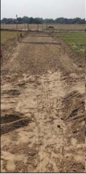
रिपोर्ट देने को कहा है।गलत मिलने पर आरोपी पर कार्यवाही होगी।